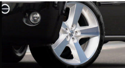
142-859-32-PK-10 / 142-900-37-PK MONOSTAR IV 5 Speichendesign, 19" und 20" MONOSTAR IV, 5 Spoke Design, 19" und 20"