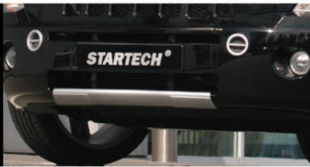
MK-200-00 / MK-210-10 Off Road-Unterfahrtschutz Design Element / Abschlepp-Design-Element, für Frontschürze Off road underride protection design add on element / Tow hook design element for front skirt