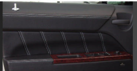
MK-EX-02 / MK-EX-03 Lifestyle Interieur / Türinnenteile, 4-teilig Lifestyle interior / door panel, 4 pieces