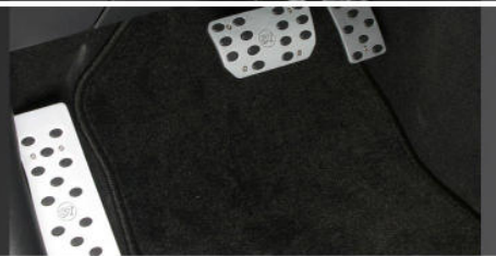
PK-819-00 / PK-819-10 Aluminium Pedalauflagen, Automatikgetriebe, 2-teilig / Aluminium Fußstütze Aluminum pedal pads, manual transmission, 2 pieces / dead pedal / foot rest, LHD only