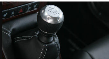
PK-826-00 / MK-SS-02 Schaltknopf 6-Gang Schaltgetriebe (nur für 2.0 CRD) / Schaltsack in Leder Gearshift 6 speed manual (only for 2.0 CRD) / Gear shift boot in leather