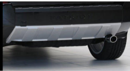
MK-400-00 Off Road-Design Abdeckung für Auspufftopf unterhalb Serien Heckschürze Off road design element covering rear silencer under rear bumper