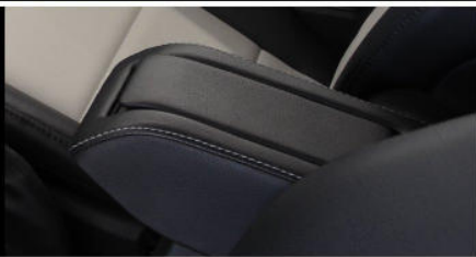
MK-EX-10 Armauflage für Mittelarmlehne Centre armrest cover