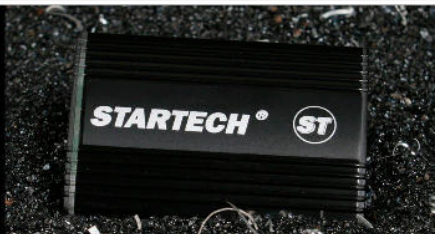
STARTECH SD 3 - Basis Jeep Patriot 2.0 CRD Hubraum / Displacement Drehmoment / Torque bei / at Leistung / Performance bei / at Beschleunigung / 0- 100 km/h Driving Performance 0-100 km/h Höchstgeschwindigkeit / V-max

1968 cm 3 360 (310) Nm 1.750- 2.500 U/min 132/180 (103/140) kW/PS 4.000 U/min 10,6 (11,0)*s 204 (189) km/h